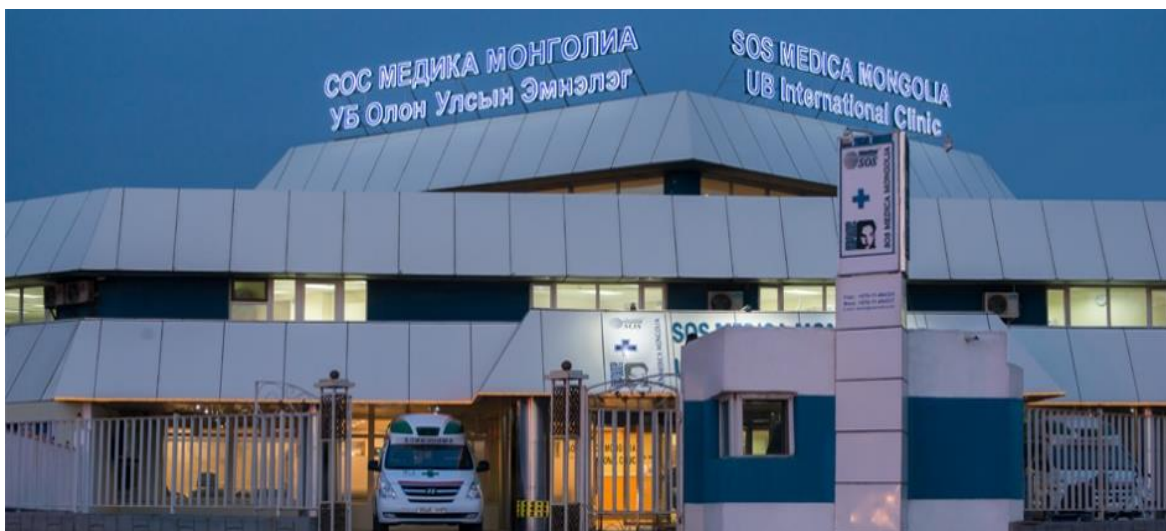
Зураг 2. СОС Медика Монголиа – төв байр.