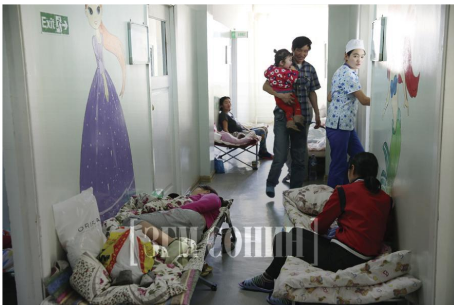
Зураг 2. Хүүхдийн эмнэлгийн ор хүрэлцэхгүй, эхчүүд, хүүхдүүд эмнэлгийн коридорт газар унтаж эмчлүүлэх явдал дор хаяад арван жил үргэлжиллээ. Энэ зургийг 2020 оны 1 дүгээр сард Засгийн газрын мэдээ сонинд хэвлэгдсэн нийтлэлээс авав. 31

СОС Медика Монголиа – 2000-аад оны эхээр уул уурхайн томоохон компаниуд Монголд үйл ажиллагаагаа эхлүүлэхэд, дипломат байгууллагууд ба олон улсын санхүүгийн байгууллагуудын дэмжлэгтэйгээр тэдгээрт үйлчлэх зорилготой байгуулагдсан анхны хувийн эмнэлгүүдийн нэг. СОС Медика Монголиа нь Улаанбаатар хотын чинээлэг дүүргүүдэд байрлах хэд хэдэн салбартай бөгөөд тэдний үйлчлүүлэгч уул уурхайн нөлөөлөлд өртсөн нутгийн иргэдийн эрүүл мэндийг хамгаалах ямар ч үүрэг хариуцлага хүлээдэггүй. Жигээлбэл, СОС Медика Монголиагийн эвакуацийн үйлчилгээ нь зөвхөн нийслэлд үзүүлдэг нарийн мэргэжлийн эмнэлгийн туслалцааг яаралтай авах шаардлагатай жирэмсэн малчин эмэгтэйчүүдэд хүртээмжгүй. Эрүүл мэндийн хүнд байдалтай эмэгтэйчүүд Гурвантэс, Ханбогд, Улаанбадрах зэрэг сумдаас Улаанбаатар хот руу машинаар нэг талдаа 500 – 780 км явж хүрдэг.